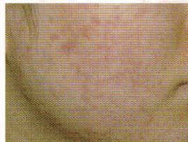
1週間ベルベット ローションを使用